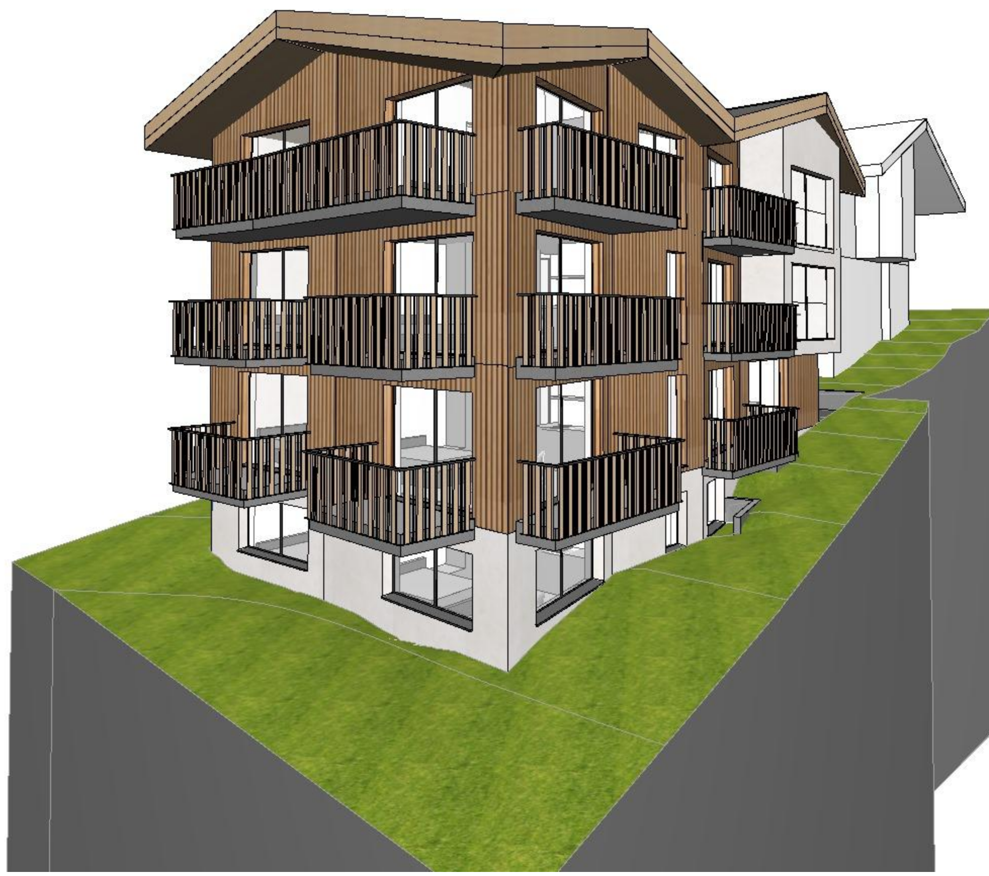
Ansicht Süd / West