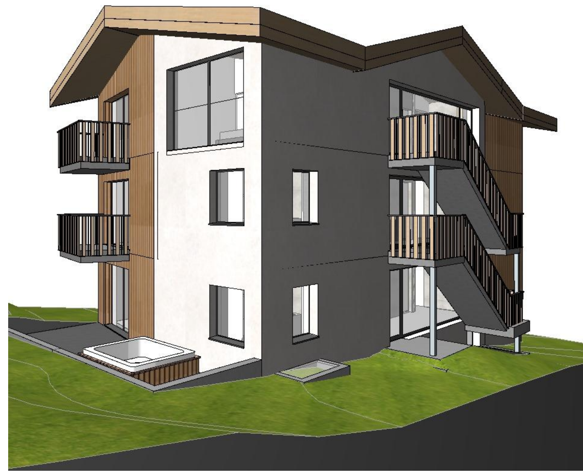
Ansicht Nord / Ost