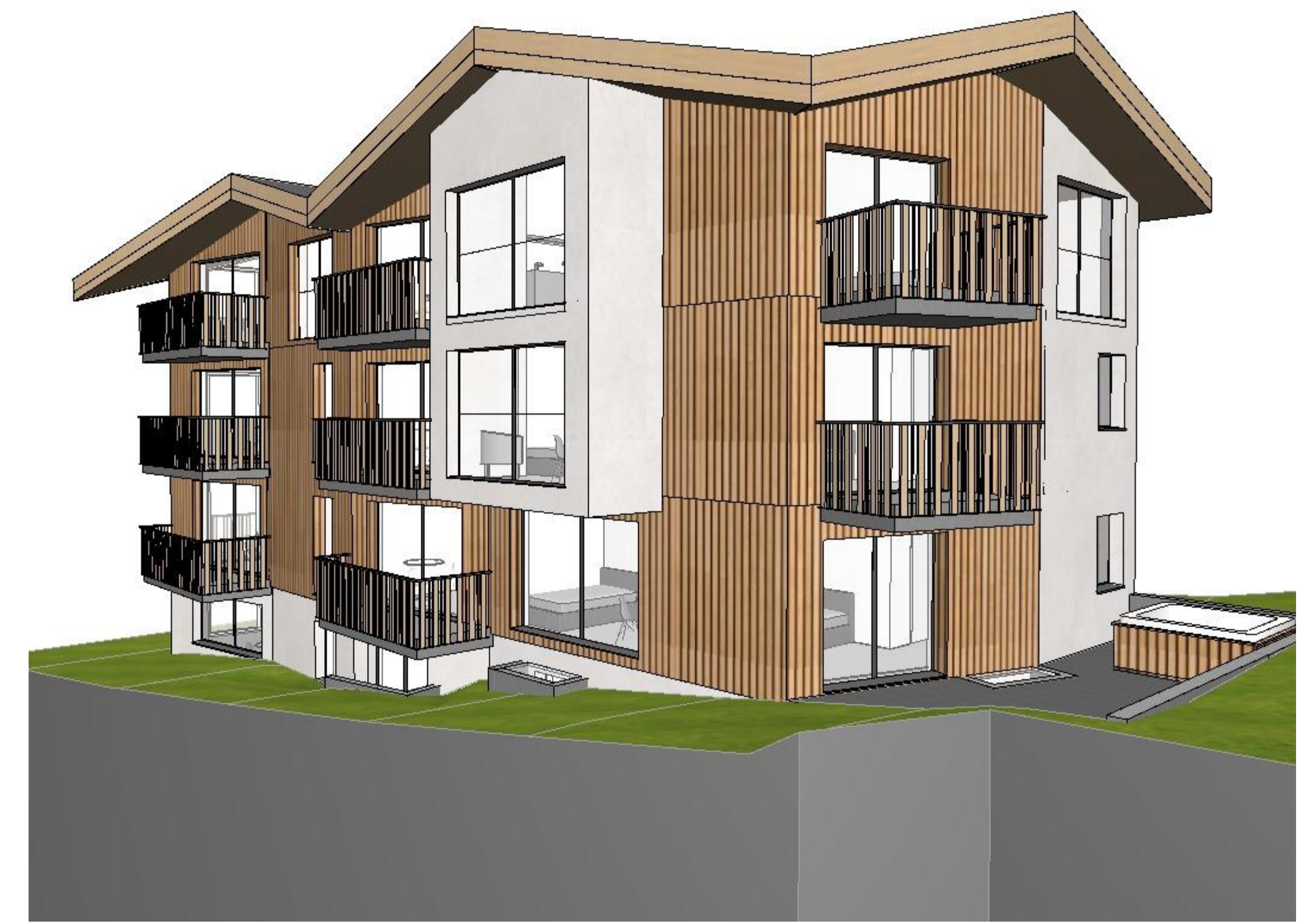
Ansicht Ost / Süd